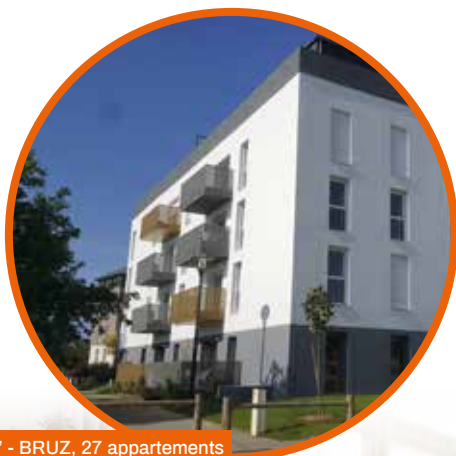
"7° ART" - BRUZ, 27 appartements

Une qualité de construction toujours plus respectueuse de l'environnement, et notre engagement vers une RT2020, garantissent plus que jamais la durabilité de nos ouvrages.