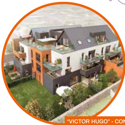
"VICTOR HUGO" - CONCARNEAU