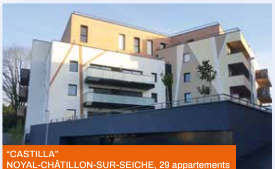
"CASTILLA" NOYAL-CHÂTILLON-SUR-SEICHE, 29 appartements