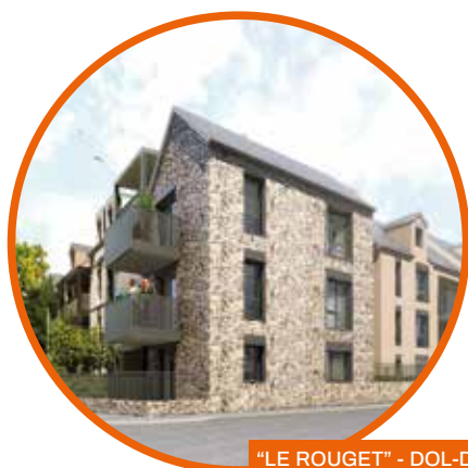
"LE ROUGET" - DOL-DE-BRETAGNE

Spécialiste de l'immobilier neuf en Bretagne, ACP Immo travaille depuis 1999 sur des projets bretons. Notre forte présence sur Rennes et sa Métropole, mais aussi sur les villes côtières du littoral Sud Bretagne et de la Côte d'Émeraude, nous confère une parfaite connaissance des enjeux territoriaux et une meilleure sélection des emplacements pour nos projets.