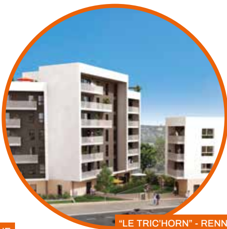
"LE TRIC'HORN" - RENNES