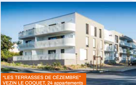
"LES TERRASSES DE CÉZEMBRE" VEZIN LE COQUET, 24 appartements