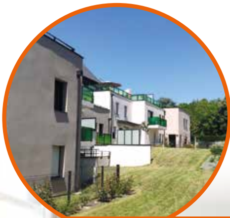
"L'ESSENTIEL" - RENNES, 26 appartements